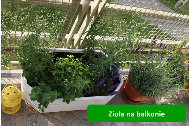
Zioła na balkonie