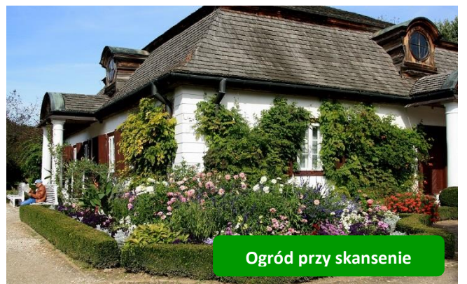
Ogród przy skansenie