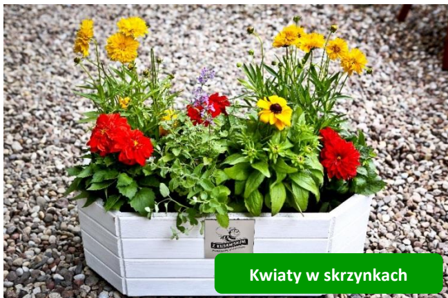
Kwiaty w skrzynkach