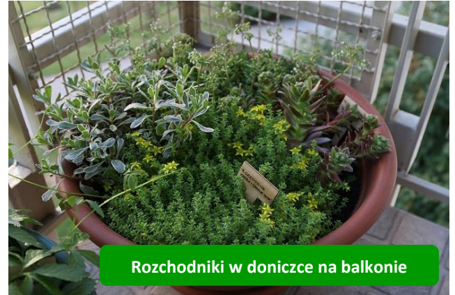
Rozchodniki w doniczce na balkonie