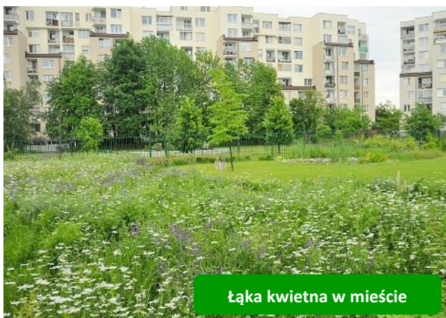
Łąka kwietna w mieście