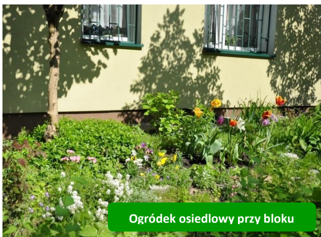
Ogródek osiedlowy przy bloku